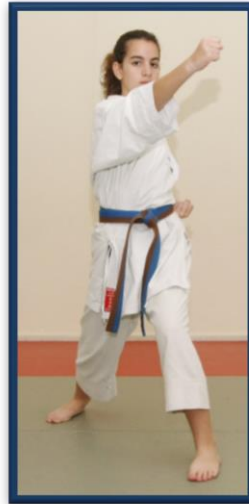
GYAKU URAKEN UCHI